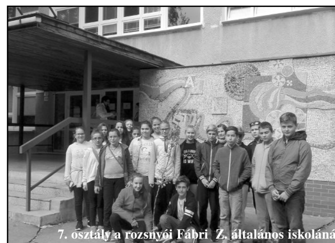
7. osztály a rozsnói Fábri Z. általános iskolánál

indultunk volna, felkerestük a Rodostó-házat, ami bemutatja, hogyan élt Rákóczi törökországi fogsága alatt. Utolsó megállóhelyünk a rozsnói iskola volt, itt átadtuk a barátságfát a szlovákiai magyar diákoknak.