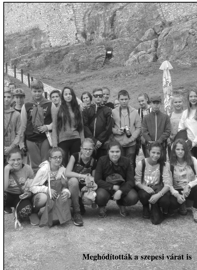
Meghódították a szepesi várat is