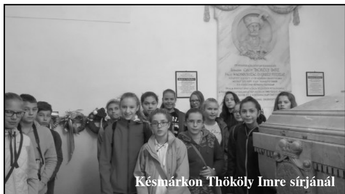
Késmárkon Thököly Imre sírjánál

Hosszas utazás után megérkeztünk az első úti célunkhoz, a betléri Andrassy-kastélyhoz. Az épület előtt egy angolkert díszelgett. A kastélyba lépve mint ha ugrottunk volna egyet az időben. A korabeli tárgyakon kívül trófeák és kitömött állatok is ékesítették a szobákat. Ezután a Dobsinai-jégbarlanghoz mentünk. Mikor beléptünk, elámult mindenki, hogy mire képes a természet. Gyönyörű formákat és érdekes képződményeket figyelhettünk meg. Mindannyiunk számára felejthetetlen élmény volt. Késő délután elfoglaltuk a tátralomnici szállásunkat. Káprázatos hegyi panoráma fogadott minket. Másnap korán reggel folytattuk kirándulásunkat. A késmárki evangélikus fatemplomot és a Thököly mauzóleumot néztük meg, ahol elénekeltük közösen a Himnuszt. Majd Lőcsén