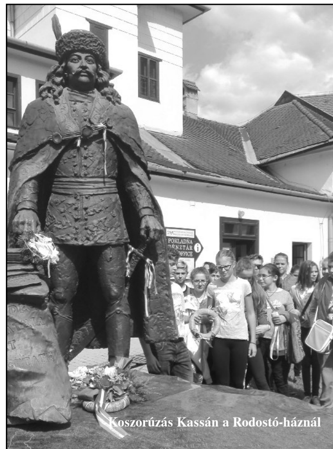
Koszorúzás Kassán a Rodostó-háznál

álltunk meg, megcsodáltuk a Thurzó-házat, a híres városházát, ahol a Fekete város című filmet forgatták. A csodálatos Szent Jakab-templom lenyűgöző volt. Rövid látogatást tettünk a Máriassy család kastélyának kertjében. Következő megállóhelyünk Szepesszombat volt, ahol megnéztük a szepesi várat. A vár egyedülálló Közép-Európában. Mielőtt a szállásra értünk volna, sétáltunk egyet Igló főterén, és megcsodáltuk a csütörtökhelyi Szent László-templomot. Utolsó nap